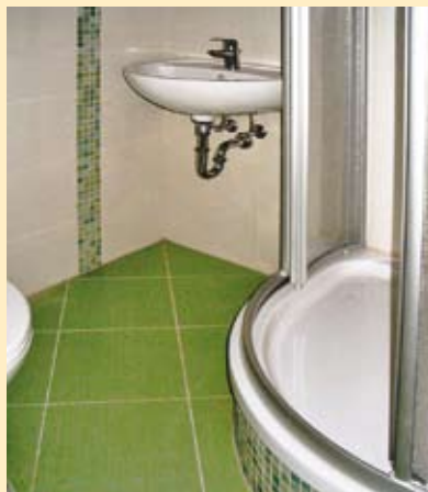
Platzsparend: 2-Raum-Wohnung mit komfortabler Eckdusche im Bad

Hier konnte man eine 2-Raum-Wohnung mit einer Fläche von 56,82 qm, in der das Bad saniert und mit einer