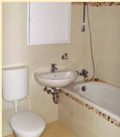
Geräumig: Sanierte 3-Raum-Wohnung mit klassischem Bad